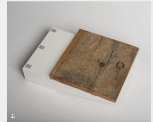
1. Opening - old wood / Apertura - Legno antico 2. Recessing case rough matt white - Window old wood / Controcassa da murare bianco opale ruvido - anta legno antico